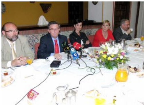
Nueva Comisión Ejecutiva de CEPES